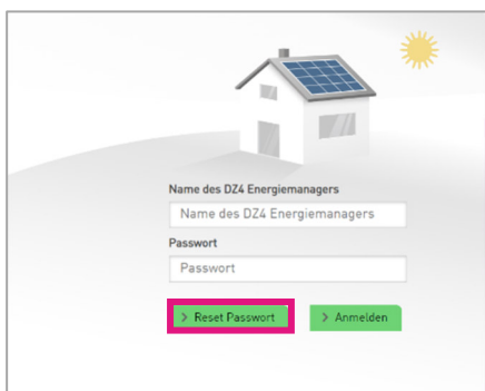
3: Passwort zurücksetzen in der Web-Ansicht

Im darauffolgenden Dialogfenster geben Sie bitte den Namen des DZ4 Energiemanagers aus der Aktivierungsmail ein, welches in der Regel Ihre Kundennummer ist.