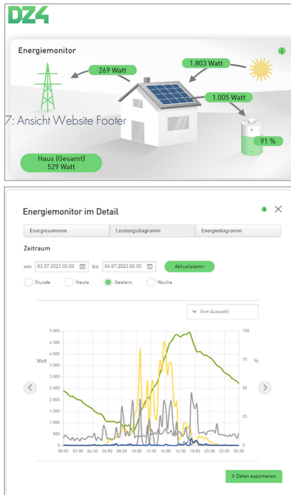
6: Beispielansicht WEB